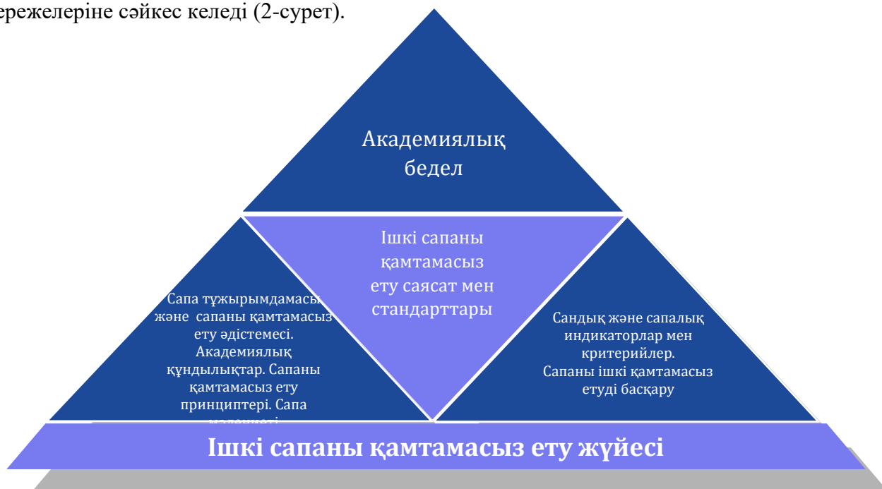
2 сурет. Ішкі сапаны қамтамасыз ету жүйесінің моделі

Сапаны қамтамасыз етудің ішкі моделі сапаны қамтамасыз етудің ұлттық моделінің ережелеріне сәйкес келеді (2-сурет).